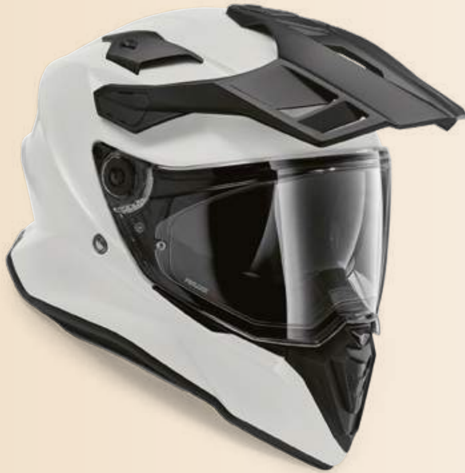
Шлем GS Pure