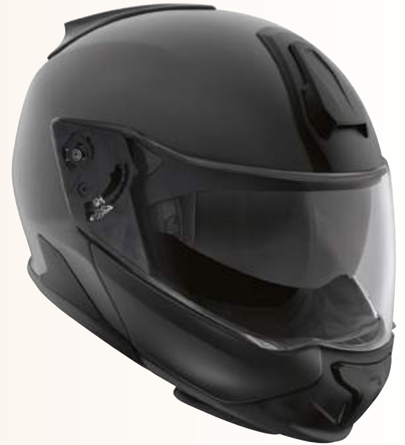
Шлем System 7 Carbon