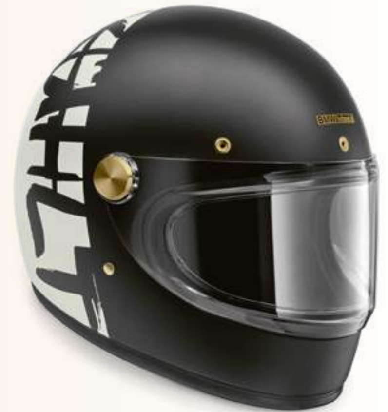
Шлем Grand Racer