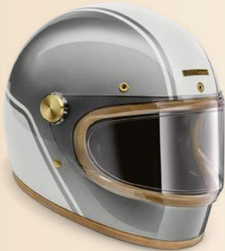
Шлем Grand Racer