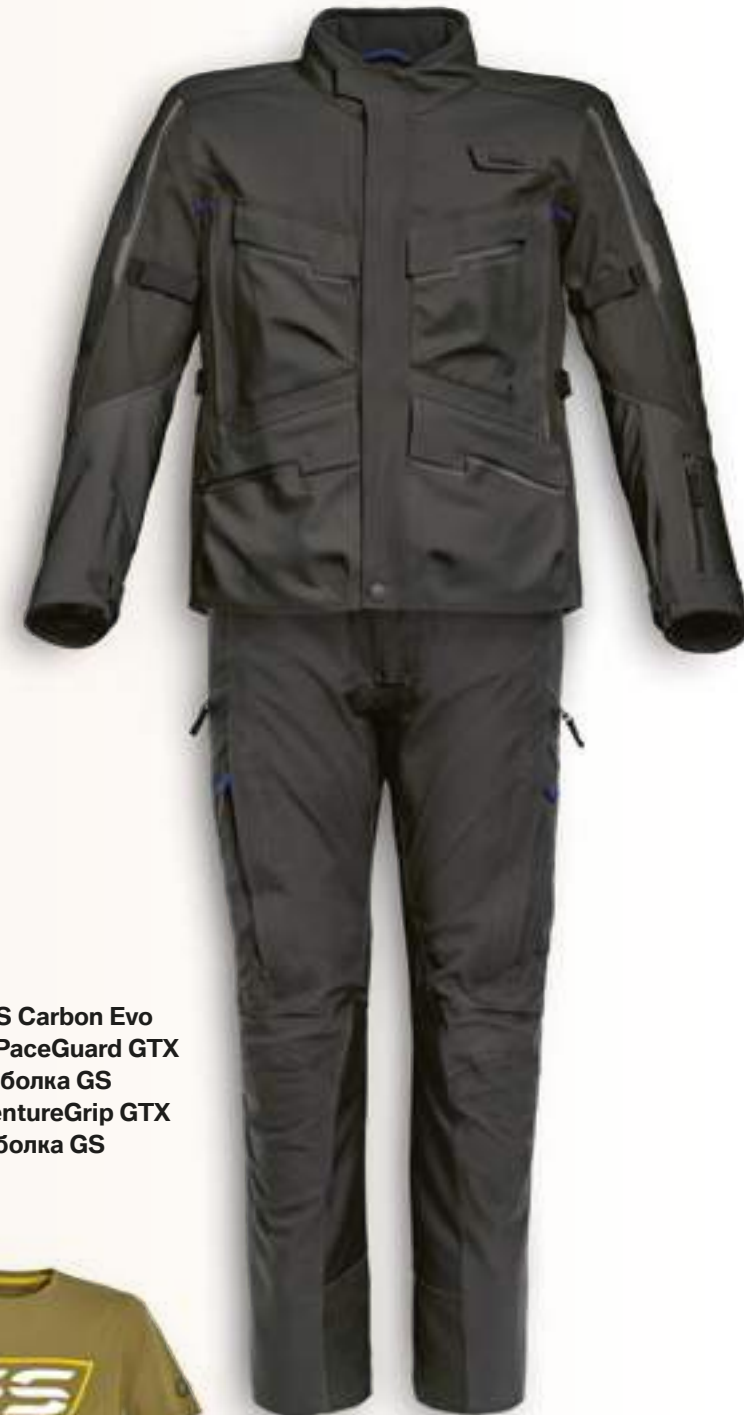
Костюм RaceGuard Adventure